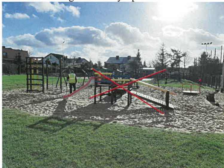
Urządzenie przeznaczone do rozbiórki

W ramach inwestycji należy zdemontować i zutylizować istniejące drewniane urządzenie zabawowe ze ślizgiem i skośnym podestem: