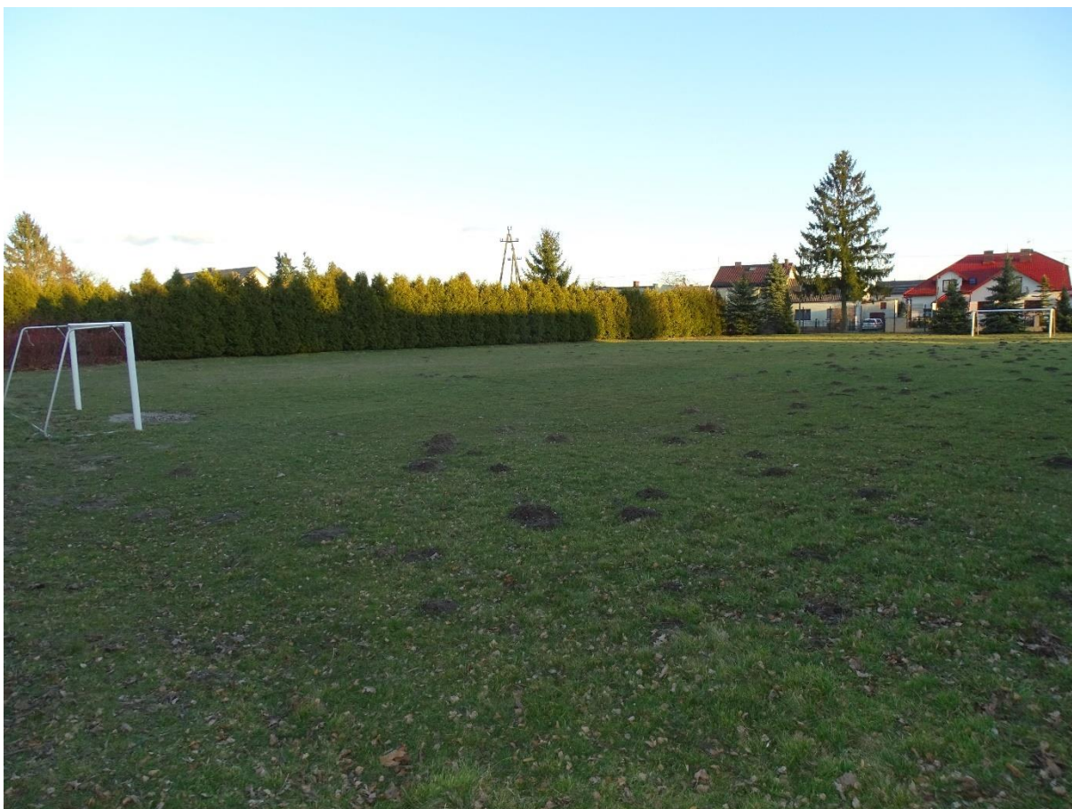
Fot.2. Widok terenu od strony północnej (od ul. Szkolnej)