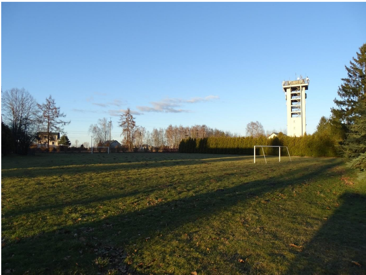
Fot.1. Widok terenu od strony południowej (od ul. Pułtuskiej)

przy Szkole Podstawowej w Świerczach, ul. Pułtуска 26A, 06-150 Świercze na dz.nr 46/3