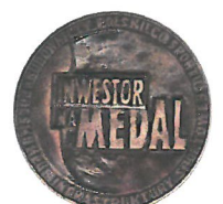
Wyróżnienie w kat. „Inwestor na Medal” w konkursie „Budowniczy Polskiego Sportu”