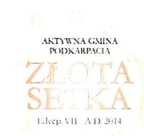
Skuteczny beneficjent środków unijnych