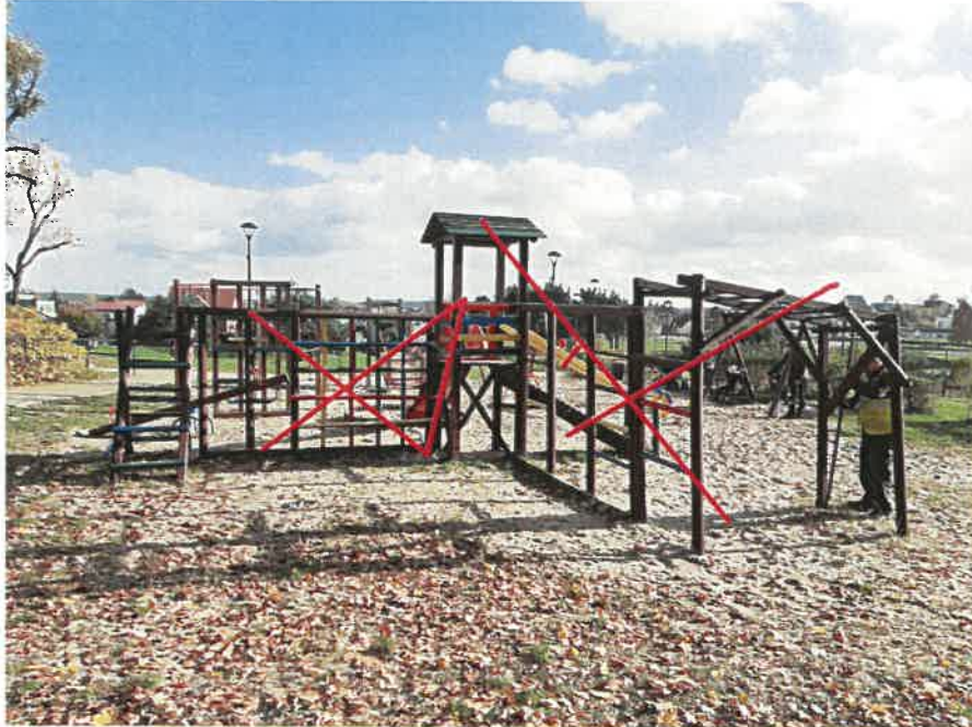
Urządzenie przeznaczone do rozbiórki

W ramach inwestycji należy zdemontować i zutylizować istniejące drewniane urządzenie zabawowe ze ślizgiem, daszkiem i zestawem drabinek: