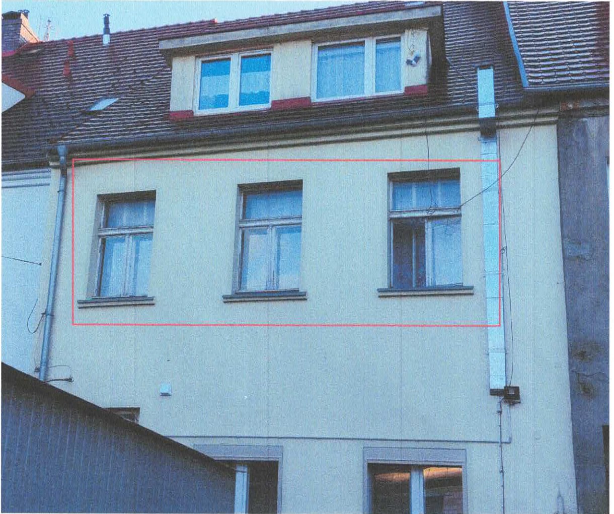
Fot. 1 – stolarka okienna przeznaczona do wymiany – widok od strony tylnej elewacji