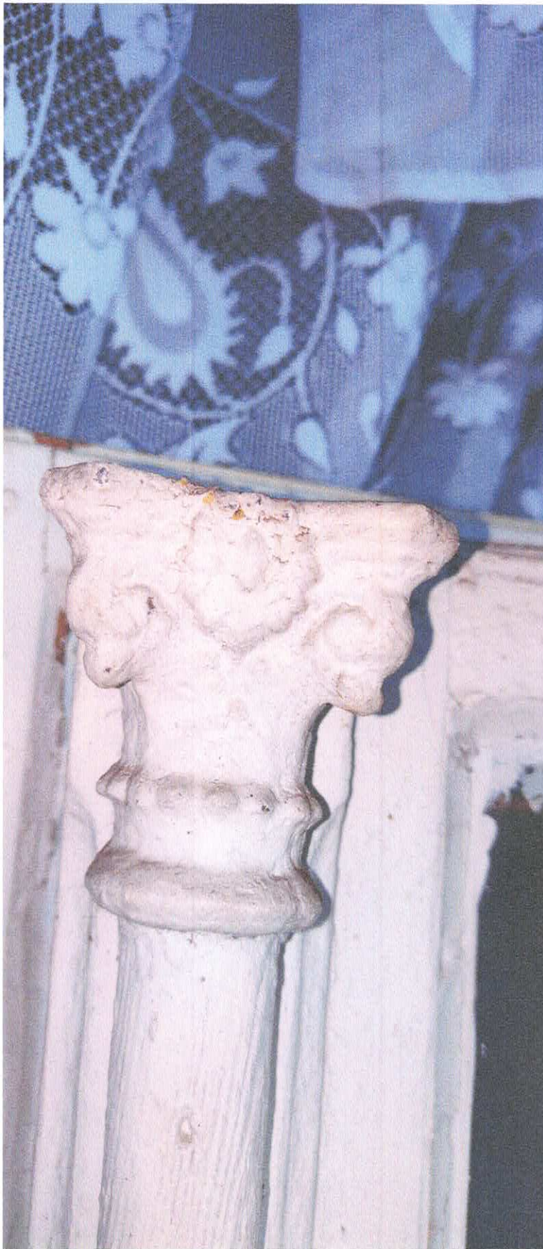
Fot. 4 - głowiczka górna