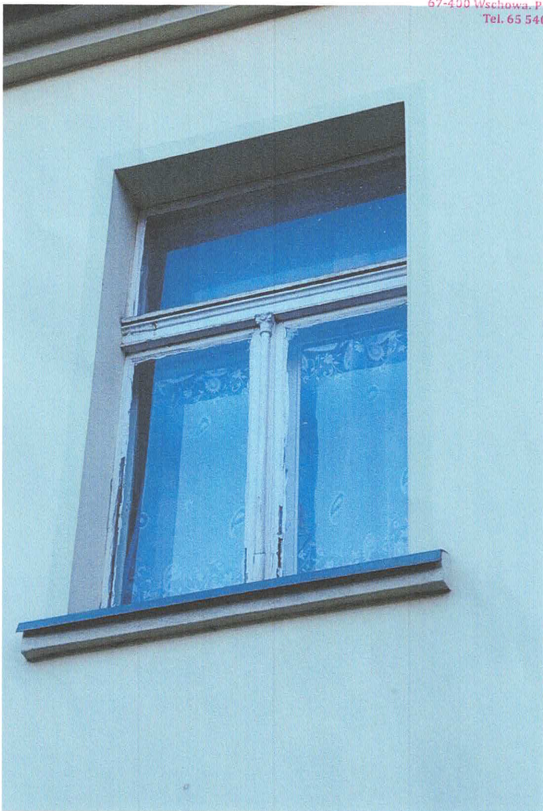
Fot. 2 – widok okna przeznaczonego do wymiany