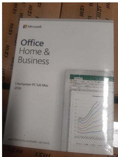
Rys. 3 Przykładowe zdjęcie pudełka dla produktu Microsoft Home&Business

produktu. Kod licencyjny znajduje się w środku szczelnie zapakowanego i zafoliowanego pudełka (Rys. 3)