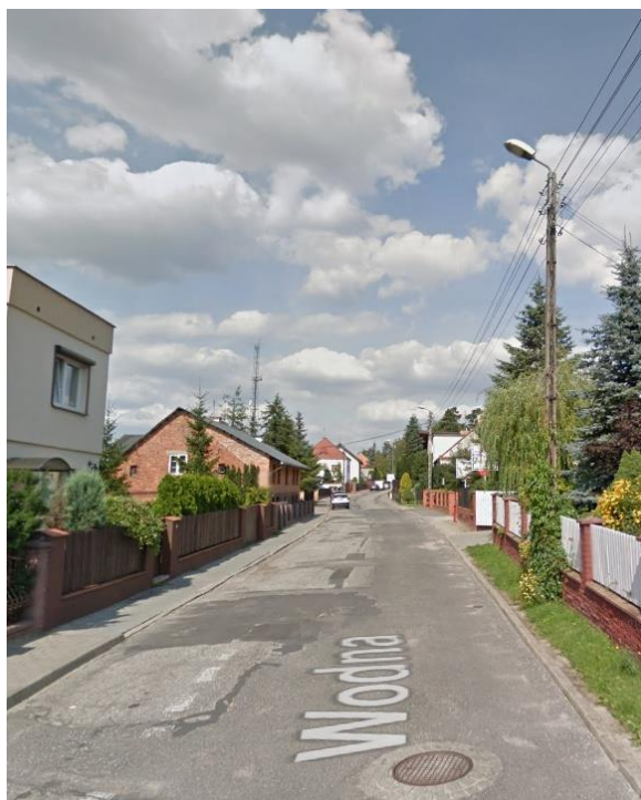
Zdjęcie nr 1 Widok słupa nn 0,4kV z oprawy oświetleniowa

Obecnie wzdłuż ulicy Wodnej i Łąkowej w Murowanej Goślinie prowadzona jest sieć niskiego napięcia 0,4kV należąca do ENEA Operator. Ulica doświetlona jest przez oprawy ENEA Oświetlenie, które znajdują się na słupach przesyłowych sieci nn 0,4kV.