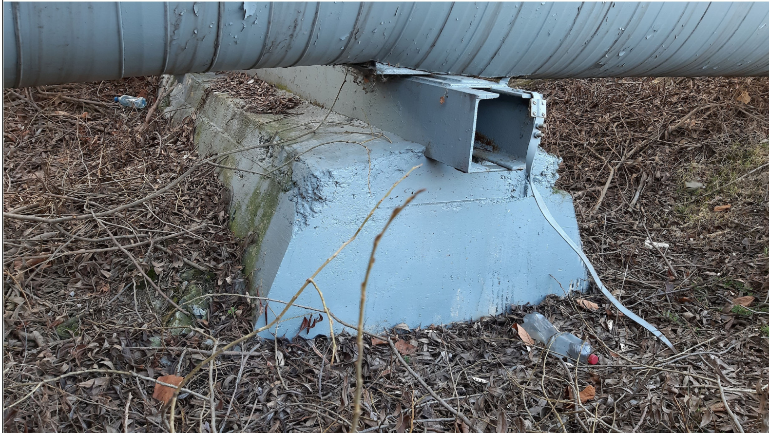
PODPORA ŚLIZGOWA TYPU B