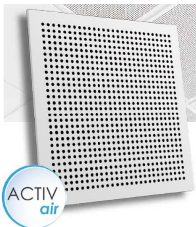
Rozmieszczenie i wielkość perforacji