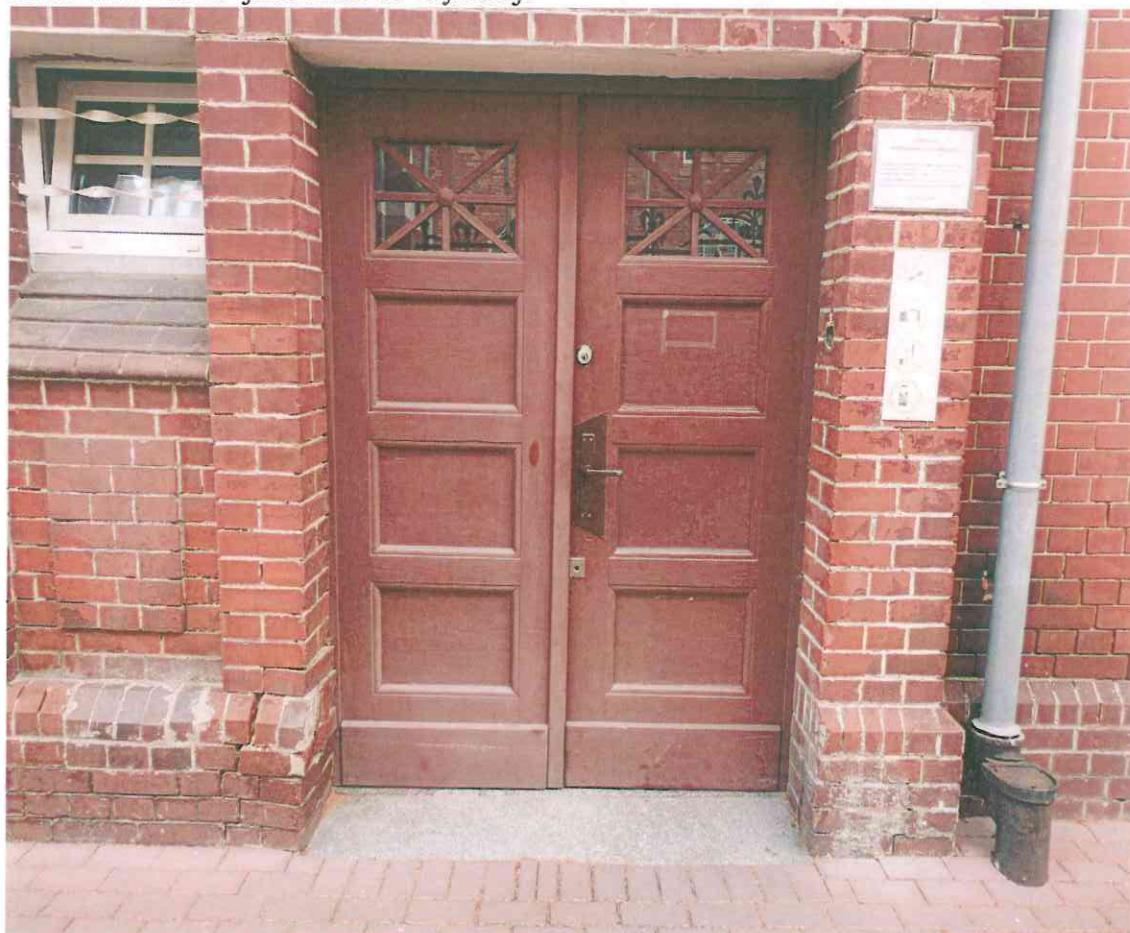
Zachowane drzwi jako wzór do stylizacji