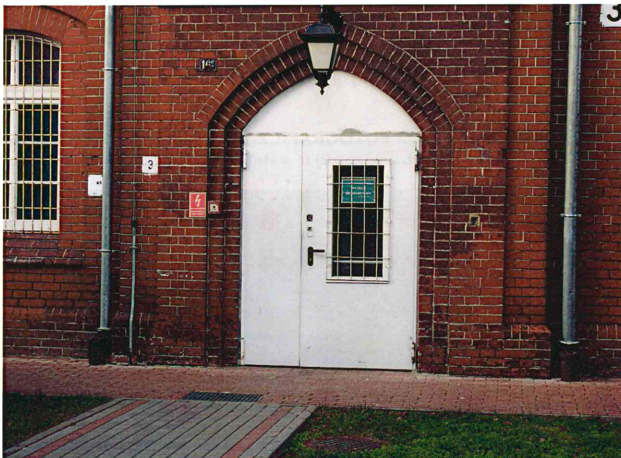
Drzwi do demontażu