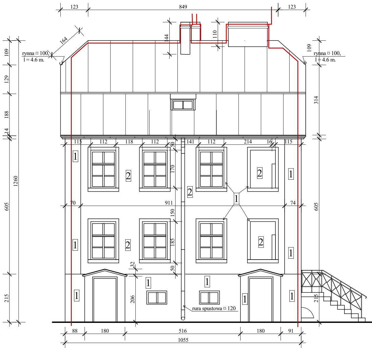
EL. PÓŁNOCNO - WSCHODNIA