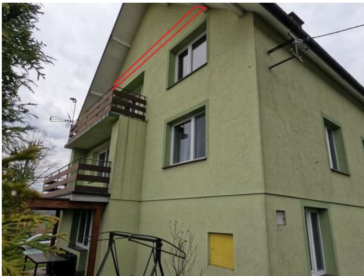
Rysunek 1 Zakres modernizacji - docieplenie stropu nad ostatnią kondygnacją