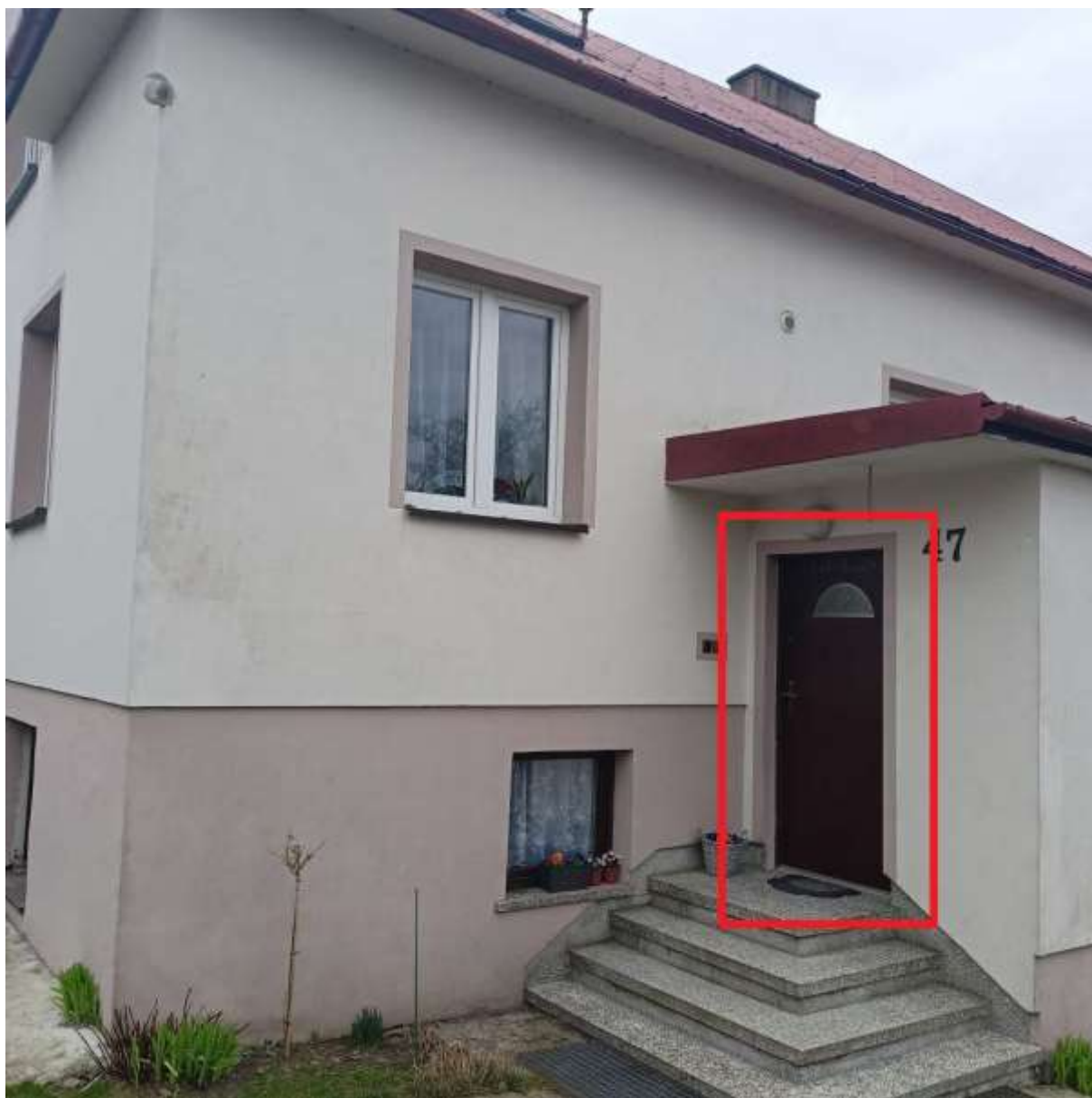
Rysunek 1 Zakres modernizacji - wymiana drzwi zewnętrznych