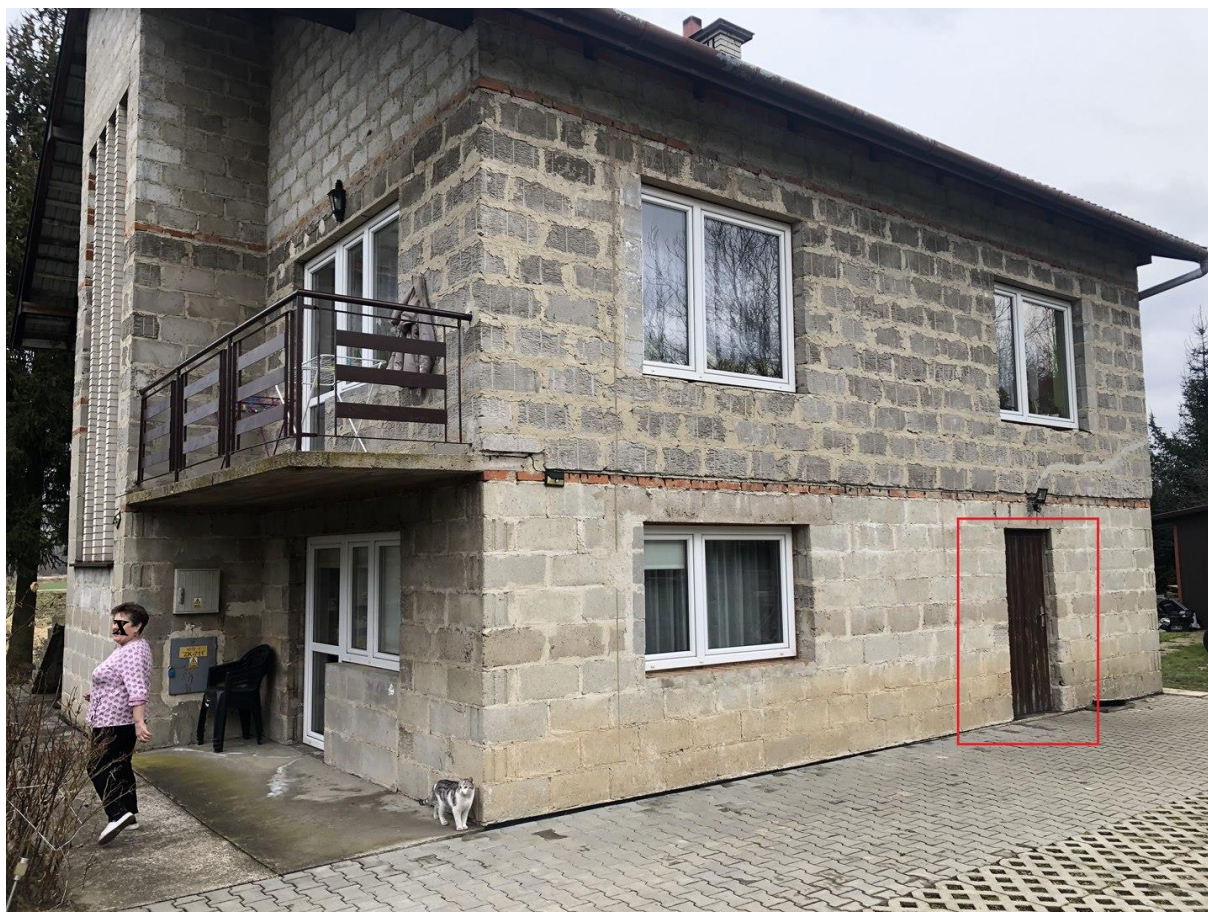
Rysunek 2 Zakres modernizacji - wymiana drzwi zewnętrznych