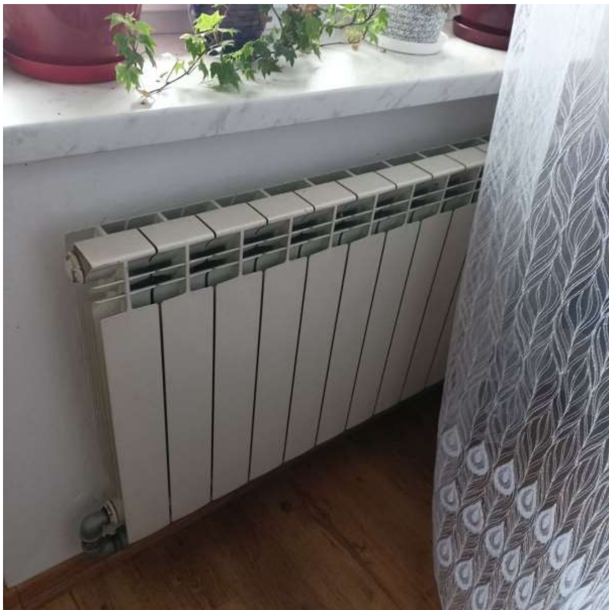
Rysunek 2 Zakres modernizacji - wymiana źródła ciepła i modernizacja instalacji co (montaż termostatów)