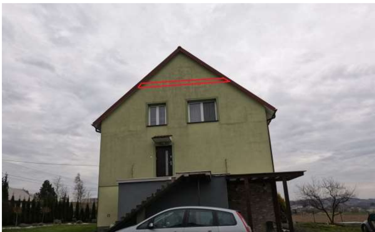
Rysunek 2 Zakres modernizacji - docieplenie stropu nad ostatnią kondygnacją