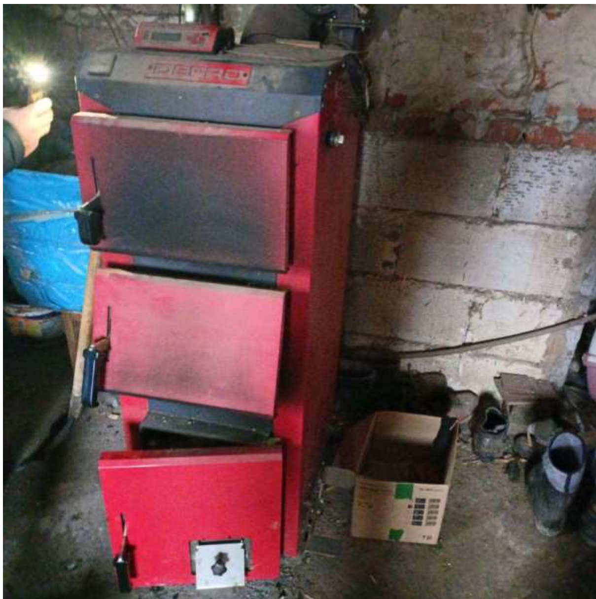
Rysunek 3 Zakres modernizacji - wymiana źródła ciepła i modernizacja instalacji co